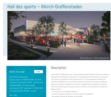
exemple de projet posté