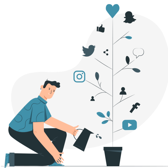
Illustration par Storyset

CAPP se dote d'une page LinkedIn - vous pourrez nous y retrouver entre deux newsletters pour des informations brèves, les inscriptions à nos formations en temps réel, le relai des publications sur notre site - et bien plus encore !