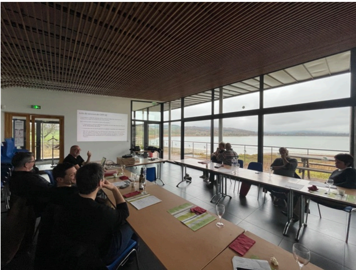
CAPP-GE en Bourgogne Franche-Comté